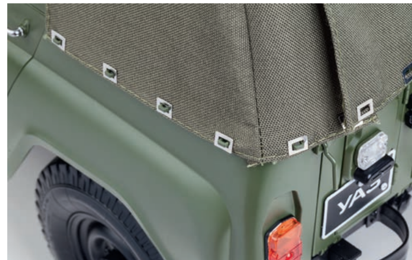
Шаг 7. Закрепите тент в задней части кузова на пяти скобах левого и правого задних крыльев кузова соответственно.