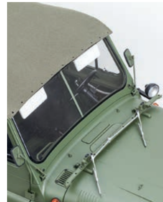
Шаг 6. Совместите отверстия в передней части тента с отверстиями рамки ветрового окна. Заново закрепите планку сквозь тент на рамке ветрового окна одиннадцатью винтами 1,7×4 (CM).