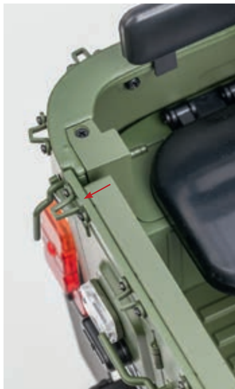
Шаг 4. Установите две высокие скобы крепления тента в верхних углах откидного борта кузова. Для крепления скоб используйте четыре винта 1,5×3 (RM).