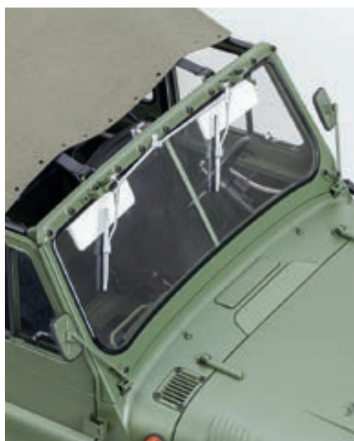
Шаг 5. Разместите тент на модели поверх каркаса. Демонтируйте верхнюю планку ветрового окна вместе с механизмом стеклоочистителей. Для этого открутите одиннадцать винтов, удерживающих планку на рамке.